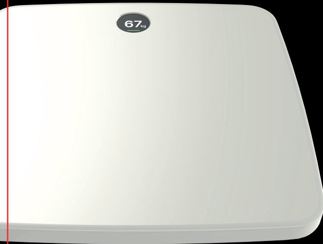
가정용 신체 밸런스 분석 디바이스 Scale 02 321mm * 321mm * 34.5mm

When you step on the device, the measurement results are recorded in conjunction with the Fisica application. We will analyze your body shape in comfortable way and provide a variety of content for optimized management.